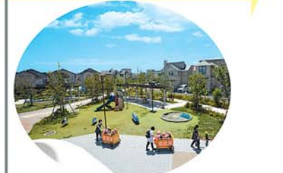
ストリートファニチュアが醸し出す 新しいサービスの形