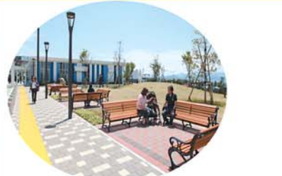
ストリートファニチュアで彩る これからの憩いの空間