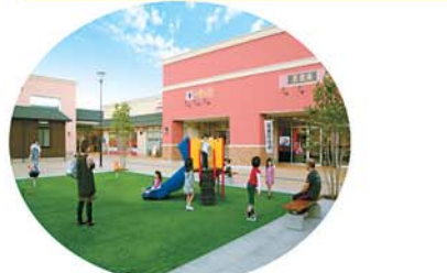
ストリートファニチュアでつくる これからの賑わいのイメージ

住 環境 宅地開発、スマートシティ マンション、集合住宅 さまざまな住空間に関わる企業 デベロッパー、まちづくり会社 民間事業者、ハウスメーカーなど