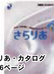
さらりあ・カタログ A4・36ページ