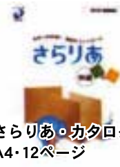
さらりあ・カタログ A4・12ページ